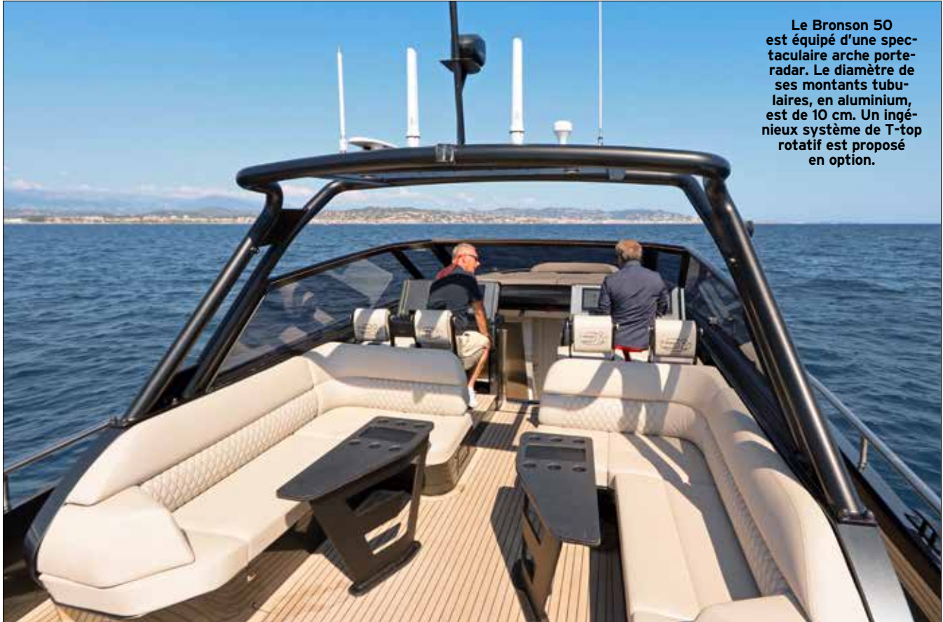
Le Bronson 50 est équipé d'une spectaculaire arche porte-radar. Le diamètre de ses montants tubulaires, en aluminium, est de 10 cm. Un ingénieux système de T-top rotatif est proposé en option.