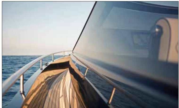
De belle hauteur, les pavois, surmontés de mains courantes tout au long du bateau, permettent de circuler aisément et en sécurité.

► niveau inférieur. Une position qui lui permet de faire office de trait d'union avec l'intérieur du bateau. Espace repas et cuisine cohabitent au pied des six échelons de la descente. D'inspiration très contemporaine, on y relève un très haut niveau de finition. Surtout, cet espace ouvert peut être hermétiquement clos par le biais d'un toit translucide coulissant. Une fois de plus, c'est bluffant ! En termes d'aménagements, le Bronson 50 abrite deux cabines doubles. Disposant chacune de leur salle de bain, elles bénéficient toutes deux d'une literie haut de gamme, ►